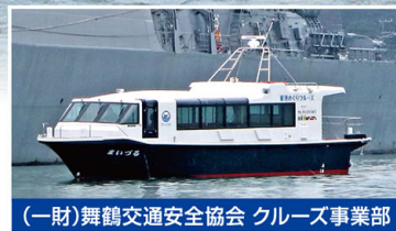
(一財)舞鶴交通安全協会 クルーズ事業部